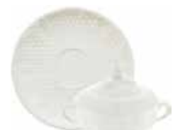
Tasse à bouillon couverte avec soucoupe (x 2) Covered bouillon bowl with lugs & saucer Bouillontasse mit Henkeln und Deckel 20 cl - Ø 17,3 cm - 7 oz. 7" dia 11512PTB34