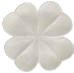
Kaolin Kaolin White 1868CT0185