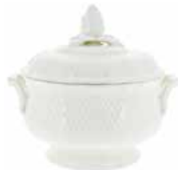
Légumier (x 1) Covered vegetable Ragout Schüssel 2 L 15 71 oz 1151CLEG34