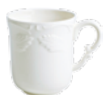
Mug (x 1) Mug Henkelbecher 33 cl. H 10,2 cm 11 1/8 " oz 1800CMUG14