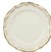
Assiette dessert (x1) Dessert plate Dessertteller Ø 23,2 cm - 9 1/8" dia 1837CADE22