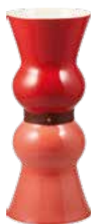
GM Terracotta Rubis Ruby and Terracotta, large Terrakotta Rubis, groß 1034CVSG00