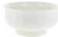
Saladier (x 1) Open vegetable Salatschüssel N° 1 - Ø 21 cm - 1 L 75 8 1/4" dia. 59 3/16 oz 1151CSA134 N° 2 - Ø 27 cm - 3 L 20 10 2/3" dia. 100 oz 1151CSA234