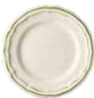
Vert - Green