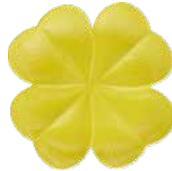
Citron Lemon 1868CT1885