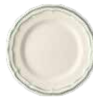
Céladon - Earth Grey