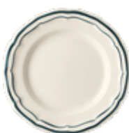
Acapulco - Ocean Blue