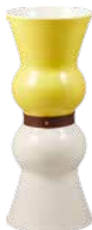
GM Kaolin Jaune Yellow and Kaolin White, large Kaolin Gelb, groß 1030CVSG00

Siam Vase, large Vase Siam, groß Ø 18 cm - H 44 cm 7 3/32 " dia - 17 5/16 " h