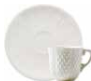
Tasse, soucoupe à thé U.S. (x 2) U.S. tea cup & saucer U.S. Teetasse mit Untertasse 19 cl - Ø 16 cm - 7 oz. 5 3/4" dia 11512PTU34