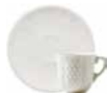
Tasse, soucoupe à café (x 2) Espresso cup & saucer Espressotasse mit Untertasse 9 cl - Ø 12,8 cm - 4 oz. 5 1/4" dia 11512PTC34