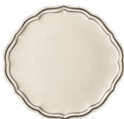
Plat à gâteaux (x1) Cake platter Kuchenplatte Ø 31,7 cm - 12 1/2 " dia *BPGA22