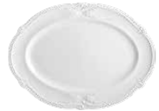
Plat ovale (x 1) Oval platter Platte oval 38,6 x 28,5 cm - 15 3/16 " x 11 1/4 " 1800COV614