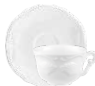
Tasse, soucoupe à café (x2) Espresso cup and saucer Espressotasse mit Untertasse 10 cl - Ø 14 cm 3 3/8 " oz - saucer 5 1/2 " dia 18002PTC14