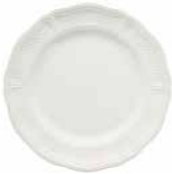
Assiette de présentation (x 1) Charger (x 1) Platzteller Ø 32,5 cm - 12 13/16" dia 1151C1AP34