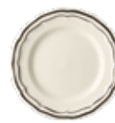
Assiette canapés (x4) Canape plate Cocktailteller Ø 16,5 cm - 6 1/2 " dia *B4A522