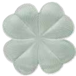
Céladon Earth Grey 1868CT0485