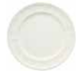
Assiette canapés (x 4) Canape plate Brotteller Ø 18,3 cm - 7 3/16" dia 1151B4A534