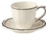
Tasse, soucoupe à thé US (x2) US Tea cup & saucer US Teetasse mit Untertasse 17,5 cl. Ø 8,5 cm. H 7,5 cm Ø 14,5 cm Cup 3 3/8" dia. 5 15/16" oz - Saucer 6" dia *2PTU49