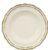
Assiette creuse (x1) Rim soup Teller tief Ø 22,5 cm - 8 7/8" dia 1837CACR22