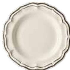
Plat creux (x1) Round deep dish Platte rund tief Ø 31 cm - 12 3/16 " dia *CPC622