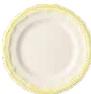
Citron - Lemon