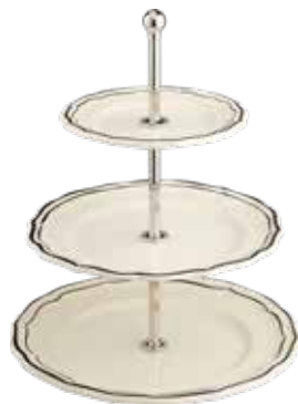
Serviteur muet (x1) Three-tier cake stand Servierständer Ø 26 cm - H 30 cm 10 1/4" dia - 11 13/16" h *SEMU22

* Indiquer le code du coloris du décor choisi (P. 45) - Indicate the colour code of the chosen decor (P. 45)