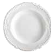
Assiette creuse (x 4) Rim soup Teller tief Ø 22,3 cm - 8 3/4 " dia 1800B4AY14