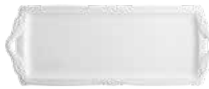
Plat à cake (x 1) Oblong serving tray Königskuchenplatte 39 x 15,2 cm - 15 3/8 " x 6" 1800CPCA14