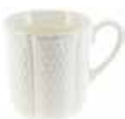
Mug (x 1) Mug Henkelbecher 33 cl - H 10,2 cm 11 1/8 oz. 4" h 1151CMUG34