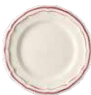
Pivoines - Peony