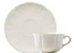
Tasse, soucoupe à déjeuner (x 2) Breakfast cup & saucer Frühstückstasse mit Untertasse 27 cl - Ø 16 cm - 12 oz. 5 3/4" dia 11512PTA34