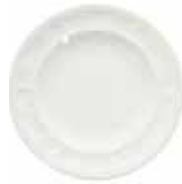
Assiette creuse (x 4) Rim soup Teller tief Ø 24,2 cm - 9 1/2" dia 1151B4AY34