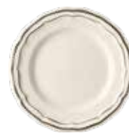
Taupe - Taupe