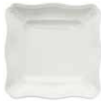
Coupe carrée (x 1) Square fruit dish Quadratische Schale 25,3 x 25,3 cm 10" x 10" 1151CCCA34