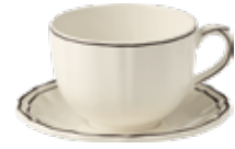
Tasse, soucoupe à déjeuner Jumbo (x1) Jumbo cup & saucer Jumbotasse mit Untertasse Ø 12,5 cm. 45 cl. H 9 cm Ø 18,5 cm. Cup 4 15/16" dia. 15 1/4" oz. 3 9/16" h - Saucer 7 1/4" dia *1PTJ26