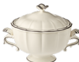
Soupière (x1) Soup tureen Terrine 3 L. Ø 33 cm 101 7/16 oz. 13" dia *CSOU22