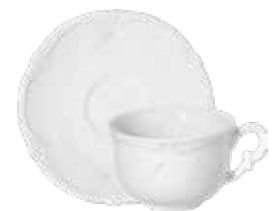
Tasse, soucoupe à déjeuner (x2) Breakfast cup & saucer Frühstückstasse mit Untertasse 40 cl - Ø 18,4 cm 13 1/2 " oz. 7 1/4 " dia 18002PTA14