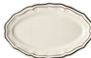
Plat ovale (x1) Oval platter Platte oval 41 x 26,2 cm - 16 1/8 " x 10 5/16 " *COV622