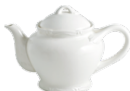
Théière (x 1) Teapot Teekanne 1 L 10 - H 15,5 cm - 37 3/7 " oz 1800CTH214