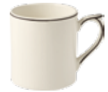
Mug (x1) Mug - Mug 25,5 cl. H 9,5 cm 8 5/8 oz. 3 3/4 h *CMUG48