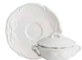
Tasse à bouillon couverte avec soucoupe (x 2) Covered bouillon bowl with lugs & saucer Bouillontasse mit Henkeln und Deckel 19 cl - Ø 18,4 cm - 6 7/16 " oz. 7 1/4 " dia 18002PTB14