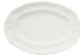
Plat ovale (x 1) Oval platter Platte oval N° 4 - 37,2 x 25,8 cm 14 1/2" x 10 1/4" 1151COV434 N° 6 - 42,5 x 29,8 cm 16 3/4" x 11 3/4" 1151COV634