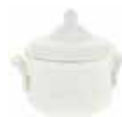
Sucrier (x 1) Sugar bowl Zuckerdose 25 cl - H 12 cm - 10 oz 1151CSU034