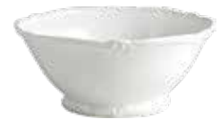
Saladier (x 1) Open vegetable Salatschüssel Ø 24,7 cm - 1 L 45 9 3/4 " dia. 49 oz 1800CSA114