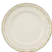
Assiette plate extra (x1) Dinner plate Eßteller Ø 26 cm - 10 1/4" dia 1837CAEX22