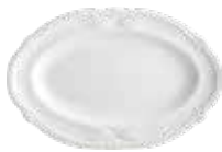
Ravier (x 1) Pickle dish Beilage 25 x 16,7 cm - 9 13/16 " x 6 9/16 " 1800CRAV14