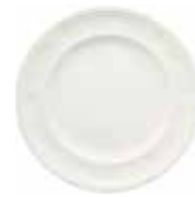
Assiette dessert (x 4) Dessert plate Dessertteller Ø 23,2 cm - 8 1/2" dia 1151B4AB34