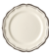
Assiette dessert (x4) Dessert plate Dessertteller Ø 23,2 cm - 9 1/8 " dia *B4AB22