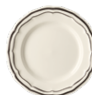
Manganèse - Midnight