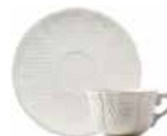
Tasse, soucoupe à thé (x 2) Tea cup & saucer Teetasse mit Untertasse 17 cl - Ø 16 cm - 6 1/3 oz. 5 3/4" dia 11512PTH34