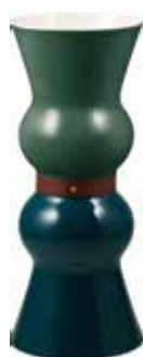
GM Acapulco Lagon Lagoon and Acapulco, large Acapulco Lagon, groß 1033CVSG00