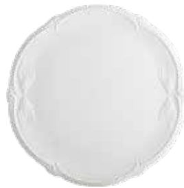
Plat à gâteaux (x 1) Cake platter Kuchenplatte Ø 34,2 cm - 13 7/16 " dia 1800BPGA14