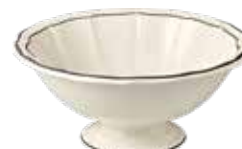
Saladier n°2 (x1) Open vegetable Salatschüssel 2 L. Ø 30 cm 67 5/8 oz. 11 13/16 " dia *CSA222