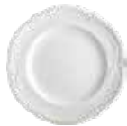
Assiette canapés (x 4) Canape plate Brotteller Ø 17 cm - 6 11/16 " dia 1800B4AQ14