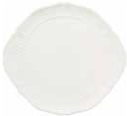
Plat à gâteaux (x 1) Cake platter Kuchenplatte Ø 32,7 cm - 12 7/8" dia 1151BPGA34