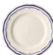
Cobalt - Cobalt