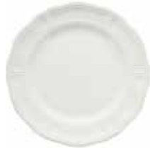
Assiette plate extra (x 4) Dinner plate Eßteller Ø 27,5 cm - 10 13/16" dia 1151B4A434