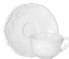
Tasse, soucoupe à thé (x2) Tea cup & saucer Teetasse mit Untertasse 18 cl - Ø 16,4 cm 6 1/16 " oz. 6 7/16 " dia 18002PTH14