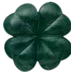
Émeraude Emerald Green 1868CT2085