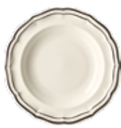
Assiette creuse (x4) Rim soup Teller tief Ø 22,5 cm - 9 1/8 " dia *B4AY22