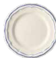
Bleu - Blue