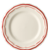
Rouge - Red