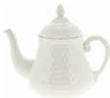
Théière (x 1) Teapot Teekanne 1 L 10 - H 21 cm - 36 oz 1151CTHE34