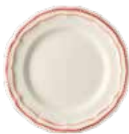
Corail - Coral