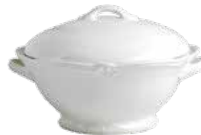
Légumier (x 1) Covered vegetable Ragout Schüssel 1 L 45 - 49 oz 1800CLEG14