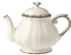
Théière (x1) Teapot Teekanne 1 L 10 - H 17,5 cm - 37 3/16 oz. 6 1/2" h *CTH248