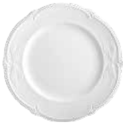
Assiette de présentation (x1) Charger Platzteller Ø 32 cm - 12 5/8 " dia 1800CPP414