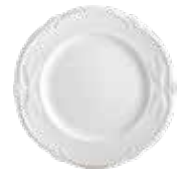
Assiette dessert (x 4) Dessert plate Dessertteller Ø 22 cm - 8 11/16 " dia 1800B4AB14