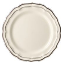
Assiette plate extra (x4) Dinner plate Eßsteller Ø 26 cm - 10 3/4 " dia *B4A422

Pièces disponibles en 11 coloris de filets